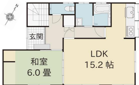
リフォーム後の間取り